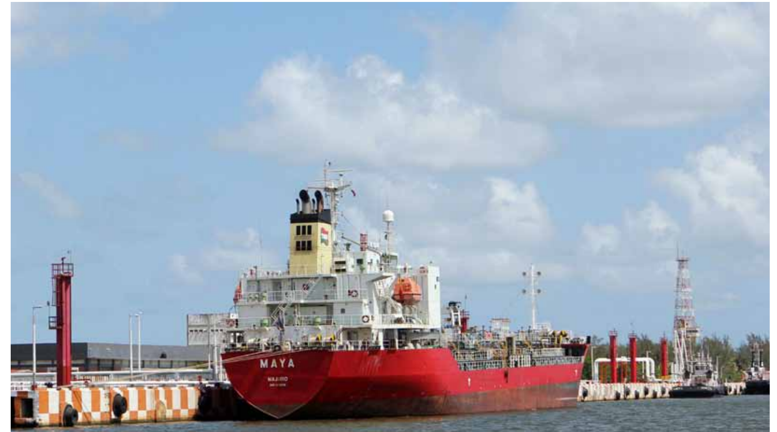
Terminal Marítima Pajaritos, Coatzacoalcos, Veracruz

Derivado de lo anterior, en el ejercicio contable 2011, se registró una pérdida neta de Ps. 91.5 miles de millones (U.S.$6.5 miles de millones).