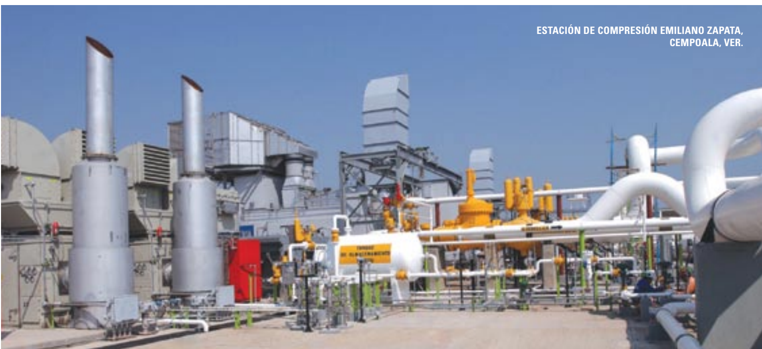
ESTACIÓN DE COMPRESIÓN EMILIANO ZAPATA, CEMPOALA, VER.

e. Productos pesados de Reynosa y líquidos transferidos a la refinería de Madero.