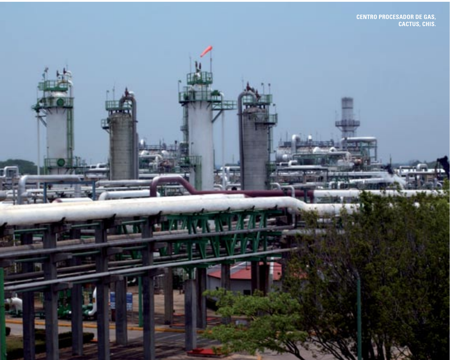
CENTRO PROCESADOR DE GAS, CACTUS, CHIS.