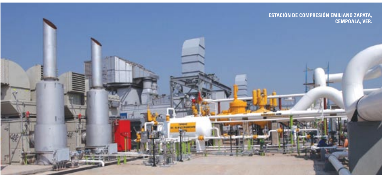
ESTACIÓN DE COMPRESIÓN EMILIANO ZAPATA, CEMPOALA, VER.

e. Productos pesados de Reynosa y líquidos transferidos a la refinería de Madero.