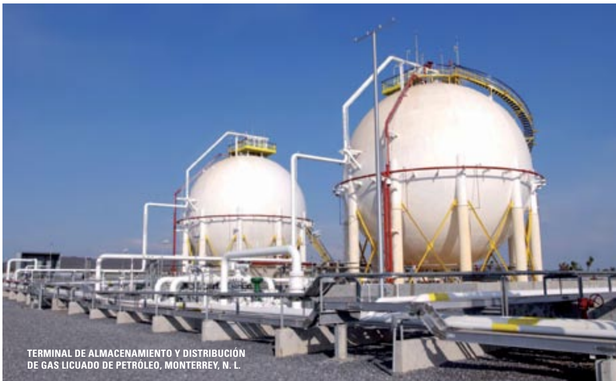
TERMINAL DE ALMACENAMIENTO Y DISTRIBUCIÓN DE GAS LICUADO DE PETRÓLEO, MONTERREY, N. L.