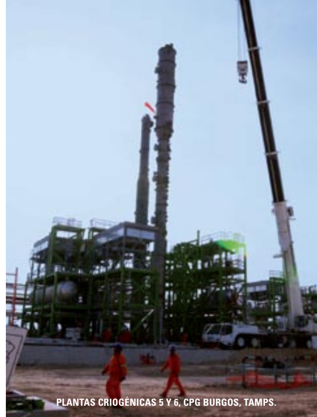
PLANTAS CRIOGÉNICAS 5 Y 6, CPG BURGOS, TAMPS.