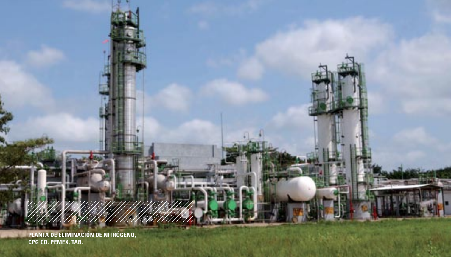
PLANTA DE ELIMINACIÓN DE NITRÓGENO, CPG CD. PEMEX, TAB.