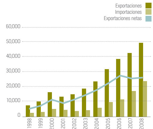
BALANZA DE COMERCIO EXTERIOR DE HIDROCARBUROS Y SUS DERIVADOS MILLONES DE DÓLARES