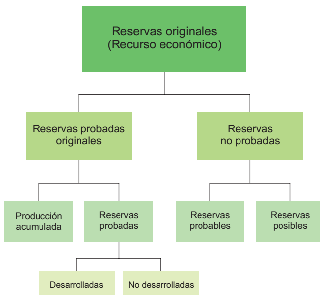
Figura 2.2 Clasificación de las reservas de hidrocarburos.

Las cantidades recuperables estimadas de acumulaciones conocidas que no satisfagan los requerimientos de comercialización deben clasificarse