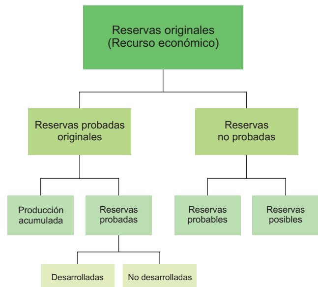
Figura 2.2 Clasificación de las reservas de hidrocarburos.

Las cantidades recuperables estimadas de acumulaciones conocidas que no satisfagan los requerimientos